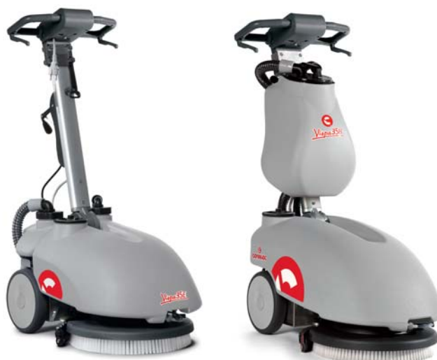
Vispa 35 E

Vispa 35 E/B occupa spazi molto ridotti e può essere parcheggiata anche in posizione verticale. N.B.: nella versione a batteria questa operazione può essere eseguita solo con batteria al gel in dotazione